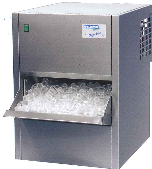
Modèles W 31 L/W

Les machines à refroidissement par air encastrables TOP-LINE-LE sont une alternative vraiment économique par rapport aux machines à refroidissement par eau. Elles ont été spécialement conçues pour être installées dans les comptoirs, ou dans un meuble. Ces appareils sont équipés d'une technique d'aération «intelligente» à circulation d'air optimale, permettant une implantation dans l'espace le plus restreint.