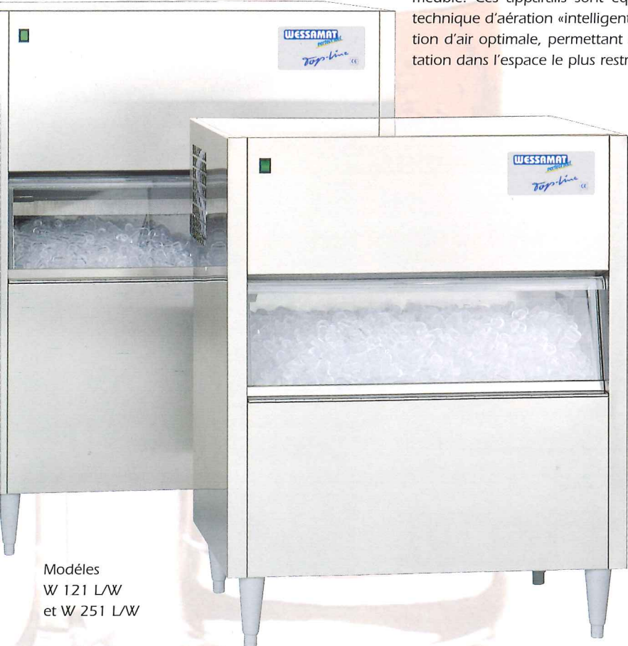
Modèles W 121 L/W et W 251 L/W

Les modèles «Top-Line» LE sont une alternative vraiment économique.